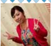
イベント情報などはホームページから